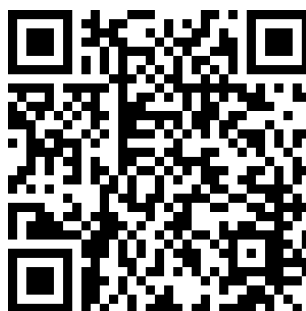
图E.2 医药产品二维码链接应用示例

如某医药产品唯一标识编码为(01)06901234567892(17)191212(10)190101(21)00001代表产品标识为6901234567892，失效日期为2019年12月12日，批号为190101，序列号为00001的医药产品，二维码链接字符串为： https://www.690699.com/gtin/06901234567892/expiry/191212/lot/190101/serial/00001 条码如图E.2所示。