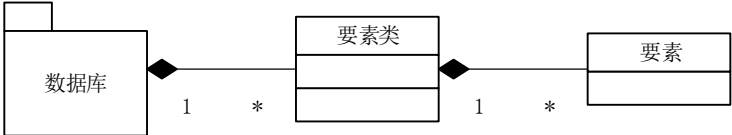
图1 基础地理信息要素数据库概念模型

基础地理信息要素数据应以空间数据库组织，包含数据库、要素类、要素三个层级。数据库由要素类组成，要素类由多个要素组成。要素类按照内容、几何类型和比例尺进行划分。